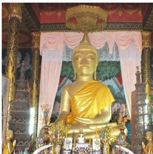
ภาพที่ 2.6 พระเจ้าใหญ่องค์ตื้อ วัดพระโต บ้านปากแซง, โดย รัตนา บุตรหมั่น, 2557.