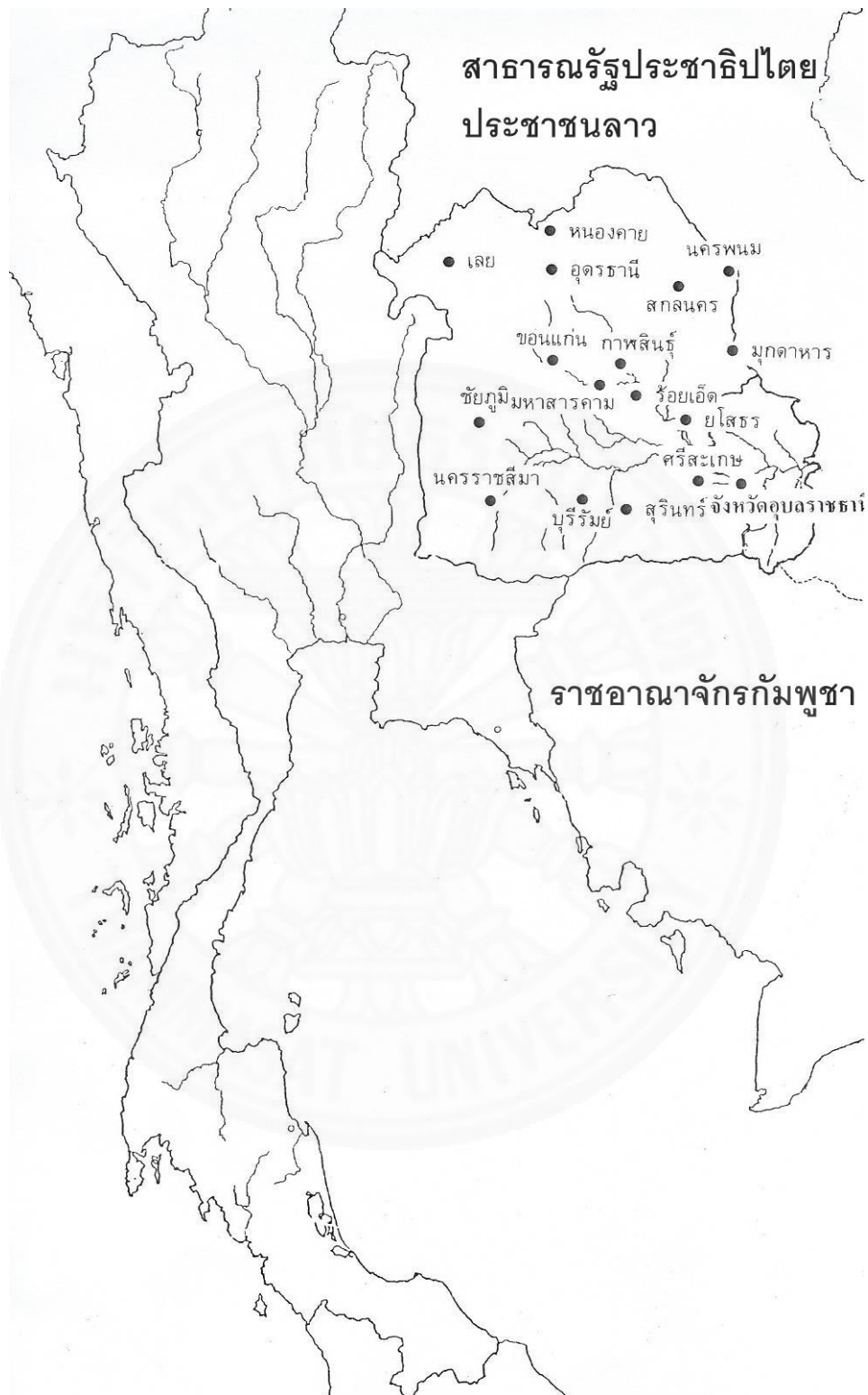
ภาพที่ 2.1 แสดงตำแหน่งที่ตั้งจังหวัดอุบลราชธานีในแผนที่ประเทศไทย, สุรศักดิ์ ศรีสำออง และคณะ, “เมืองอุบลราชธานี,” (กรุงเทพฯ: กรมศิลปากร, 2532), น.21.