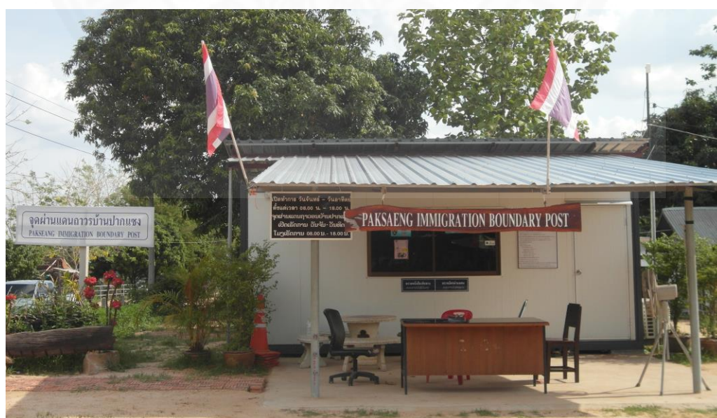
ภาพที่ 2.10 แสดงจุดผ่านแดนถาวรบ้านปากแซง, 2558.