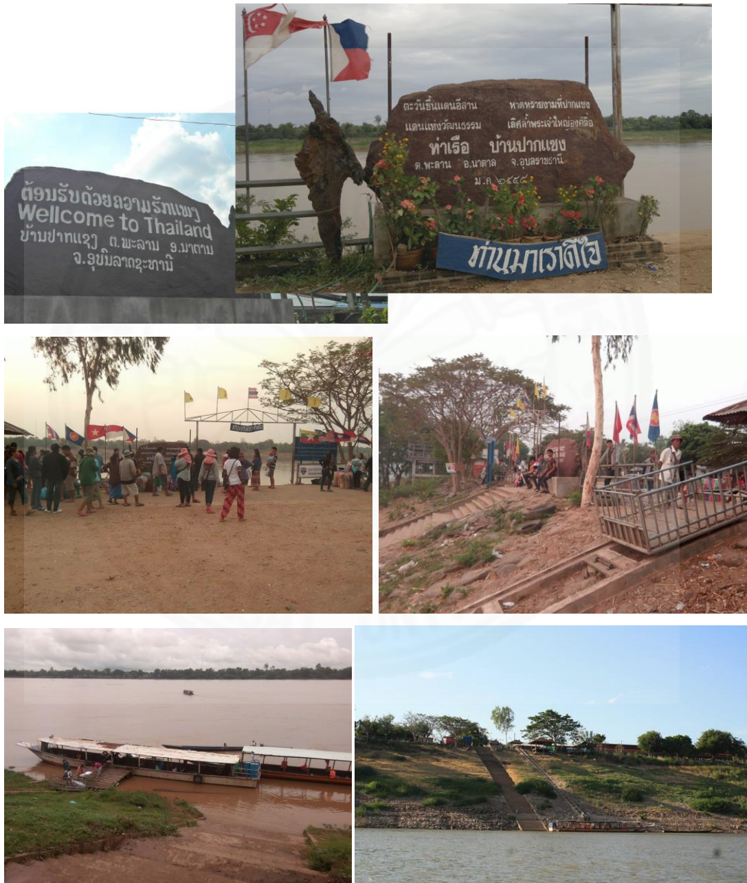
ภาพที่ 2.11 ท่าเรือบ้านปากแซง, โดย รัตนา บุตรหมั่น, 2558.

สำหรับสภาพของท่าเรือของบ้านปากแซง ดังแสดงในภาพที่ 2.11 จะอยู่ทางด้านทิศใต้ของหมู่บ้าน ชาวบ้านจะเรียกว่า “ท่าด่าน” เป็นท่าที่ใช้จอดเรือโดยสารและเป็นท่าเรือที่ทันสมัย ซึ่งนับได้ทำด้วยคอนกรีตอย่างถาวร ส่วนในการลำเลียงสินค้าหรือสัมภาระขึ้นฝั่งจะใช้รถทำด้วยลวดสลิงให้ไหลขึ้นตามรางที่ปั่นด้วยระบบไฟฟ้า