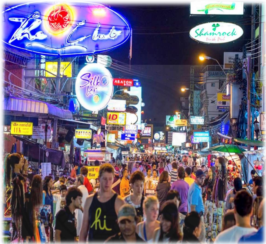
ภาพที่ 2.1 ภาพบรรยากาศในถนนข้าวสาร 13