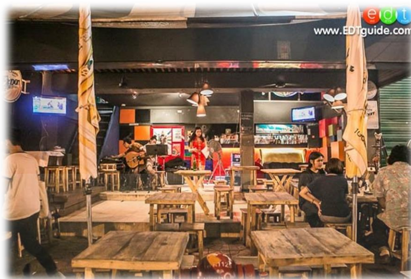
ภาพที่ 2.2 ภาพลักษณะสถานบริการในถนนพระอาทิตย์ 14