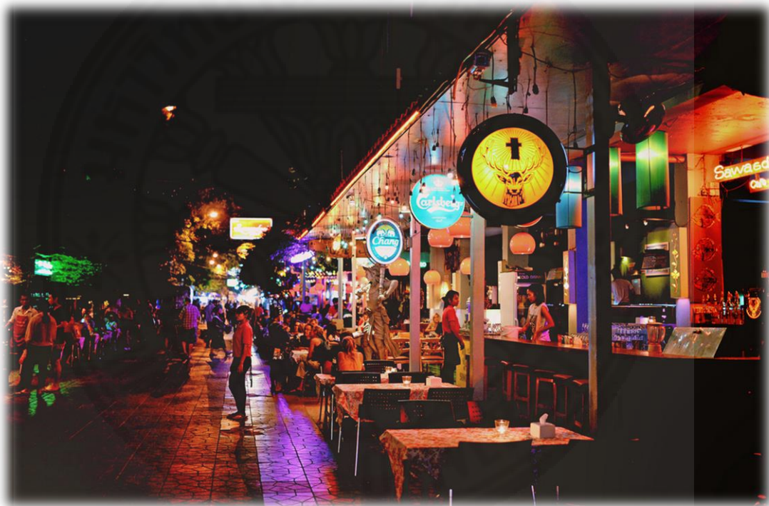
ภาพที่ 2.4 ภาพสถานบริการที่ตั้งบริเวณโดยรอบถนนข้าวสาร 16

ลักษณะของถนนข้าวสารเป็นถนนสายเล็ก ๆ ที่มีความยาวประมาณ 412 เมตร สถานบริการในบริเวณถนนข้าวสารตั้งอยู่ริมถนนทั้งสองฝั่ง เนื่องจากถนนข้าวสารเป็นถนนเส้นเล็กประกอบกับมีจำนวนนักท่องเที่ยวมาก ทำให้เกิดการขยายจำนวนสถานบริการออกไปในบริเวณใกล้เคียงถนนข้าวสารเป็นจำนวนมาก เช่น ซอยรามบุตรีที่อยู่ติดกับวัดชนะสงครามซึ่งอยู่ฝั่งตรงข้ามถนนข้าวสารโดยยาวไปจนถึงตรอกโรงไหม และในซอยอื่น ๆ ที่อยู่บริเวณโดยรอบถนนข้าวสาร เป็นต้น ในส่วนถนนพระอาทิตย์ลักษณะที่ตั้งของสถานบริการมีลักษณะเป็นห้องแถวตั้งเรียงอยู่ตลอดแนวริมถนนไปตลอดจนถึงถนนพระสุเมรุ