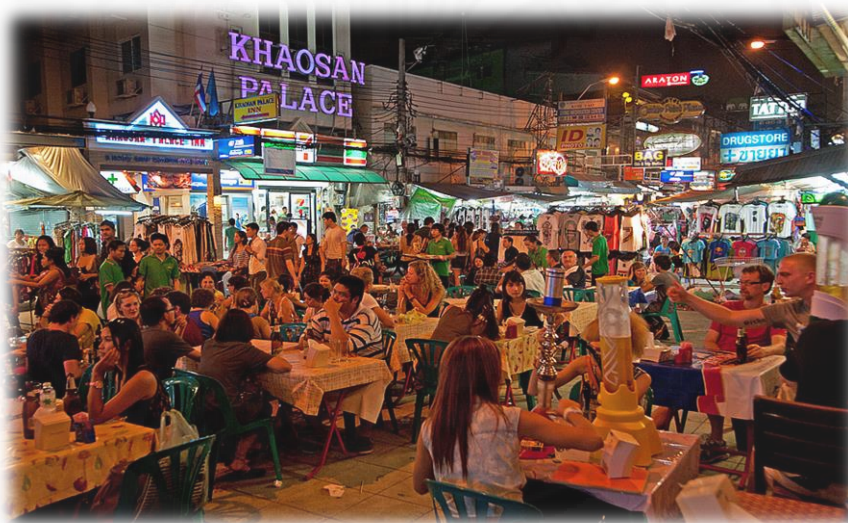
ภาพที่ 2.3 ภาพลักษณะสถานบริการในถนนข้าวสาร 15