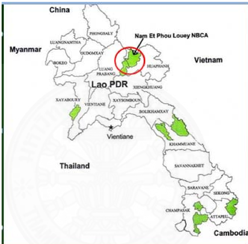
รูปภาพ 2.2 เขตพื้นที่ป่าสงวนแห่งชาติ น้ำแอด-ภูเลย ของ สปป ลาว