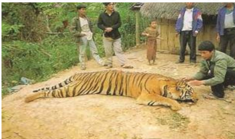
รูปภาพ 2.3 เสือโคร่งถูกยิงในเวลาที่เขาไปจับกินวัวของชาวบ้าน ในเขตพื้นที่เชื่อมต่อระหว่างแขวงหลวงพระบางกับแขวงเวียงจันทร์ เมื่อเดือนธันวาคม ปี ค.ศ. 1998