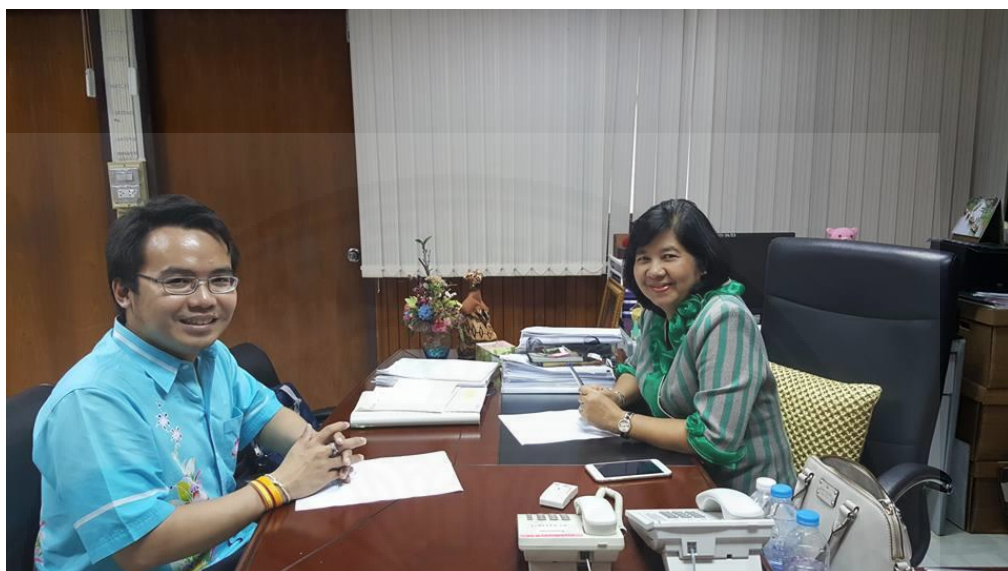
ผู้ให้ข้อมูลคนที่ 1 นางสาวนันทา มิตรงาม รองอธิบดีกรมส่งเสริมวัฒนธรรม