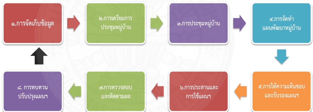
ภาพที่ 2.1 กระบวนการขั้นตอนบูรณาการจัดทำแผนพัฒนาหมู่บ้าน