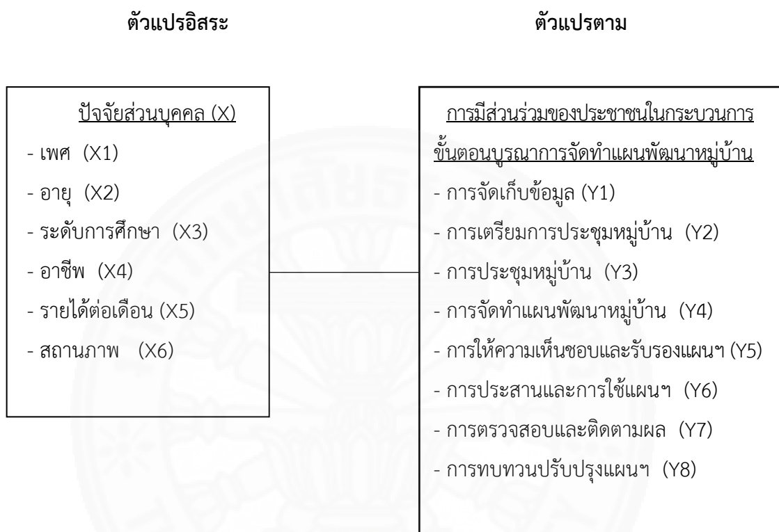
ภาพที่ 2.4 กรอบแนวคิดในการศึกษา