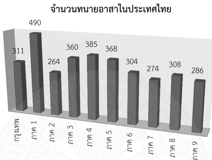
ภาพที่ 3.1 สถิติจำนวนทนายอาสาในประเทศไทย ปี 2560