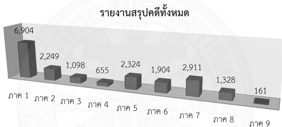
ภาพที่ 3.3 สรุปผลรายงานคดีที่ทนายอาสาในแต่ละภาครับทำคดี

ที่มา : สภานายความ ในพระบรมราชูปถัมภ์ “รายงานสถิติจำนวนคดีที่ทนายความอาสารับทำคดีของสภานายความในพระบรมราชูปถัมภ์” (ตุลาคม – กันยายน 2560).