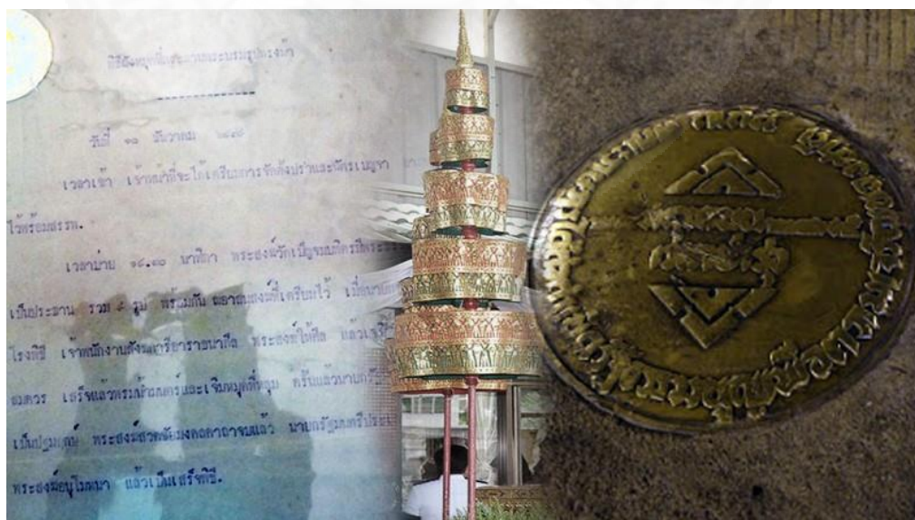
ภาพที่ 3.38 ศิลปวัฒนธรรมออนไลน์, “พิธีวางหมุดวันที่ 10 ธันวาคม 2479, ”

เมื่อวันที่ 24 มิถุนายน 2560 ก็ได้มีกลุ่มคนบางกลุ่มที่พยายามจัดกิจกรรมที่รำลึกถึงคณะราษฎรที่บริเวณ ลานหน้าเจดีย์ขาว วัดพระศรีมหาธาตุ บางเขน และมีกิจกรรมการเสวนาวิชาการที่เกี่ยวกับการพยายามขุดราก ถอนโคนโค่นมรดกคณะราษฎรด้วย สะท้อนถึงการกลับมาสนใจและรื้อฟื้นความทรงจำเกี่ยวมหุดคณะราษฎรหรือคณะราษฎรเป็นวงกว้างมากขึ้น