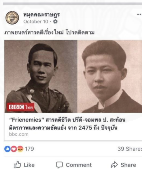
ภาพที่ 3.42 บีบีซี นิวส์ ไทย, “Frienemies สารคดีชีวิต ปรีดี-จอมพล ป. สະຫຼຳອັນມິຕຣາຖາແລະຄວາມຂັດແຍ້ງ ຈາກ 2475 ຕໍ່ ປັຈຈຸບັນ,” https://www.bbc.com/thai/thailand-41558324 (สืบค้นเมื่อวันที่ 15 พฤศจิกายน 2560).