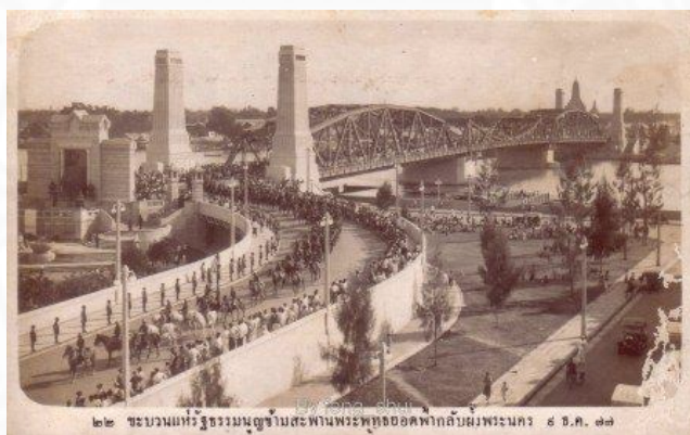
ภาพที่ 3.12 รวมภาพงานฉลองรัฐธรรมนูญแต่แรก, “งานฉลองรัฐธรรมนูญ พ.ศ.2477 ในรัฐบาลพระ ยาพหลพลพยุหเสนา,” http://oknation.nationtv.tv/blog/buzz/2016/12/11/entry-1 (สืบค้น เมื่อวันที่ 6 กุมภาพันธ์ 2561).