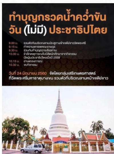
ภาพที่ 3.36 เฟสบุ๊กหมุดคณะราษฎร, “กิจกรรมรำลึกคณะราษฎร,” https://www.matichon.co.th/politics/news_588665 (สืบค้นเมื่อวันที่ 10 มิถุนายน 2560)

หลังรัฐประหาร 22 พฤษภาคม 2557 ได้ไม่นานที่ก็มีความพยายามหลายครั้งที่จะทำการลทอนหรือทำให้หมุดคณะราษฎรหมดความหมายและหมดสภาพไป และนี่ก็เป็นอีกครั้งหนึ่งที่มีคนบางกลุ่มมาทำพิธีถอนหมุดสะท้อนว่า คนเหล่านี้มิได้ศรัทธาต่อระบอบประชาธิปไตยแต่อย่างใด โดยเมื่อเดือนมิถุนายน 2558 ชาวบ้านกลุ่มหนึ่งกำลังทำพิธีกับหมุดคณะราษฎร ที่ฝังไว้ข้างพระบรมรูปทรงม้า บริเวณถนนหน้าพระที่นั่งอนันตสมาคม โดยเป็นการทำพิธีถอนหมุดออก แต่เป็นเพียงแค่การทำพิธีตามความเชื่อเท่านั้น เป็นการสะท้อนว่าอนุสาวรีย์ประชาธิปไตยและหมุดคณะราษฎรนั้นเป็นสัญลักษณ์ประชาธิปไตย มีความหมายในเสรีนิยมเชิงสัญลักษณ์อย่างเข้มข้น