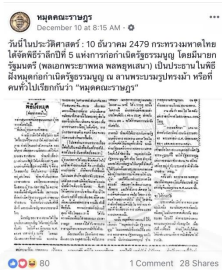
ภาพที่ 3.41 เฟสบุ๊คหมุดคณะราษฎร, “รำลึกพิธีวางหมุด 2479,” https://twitter.com/tanakorn_tu/status/854200261341925376 (สืบค้นเมื่อวันที่ 15 พฤศจิกายน 2560).