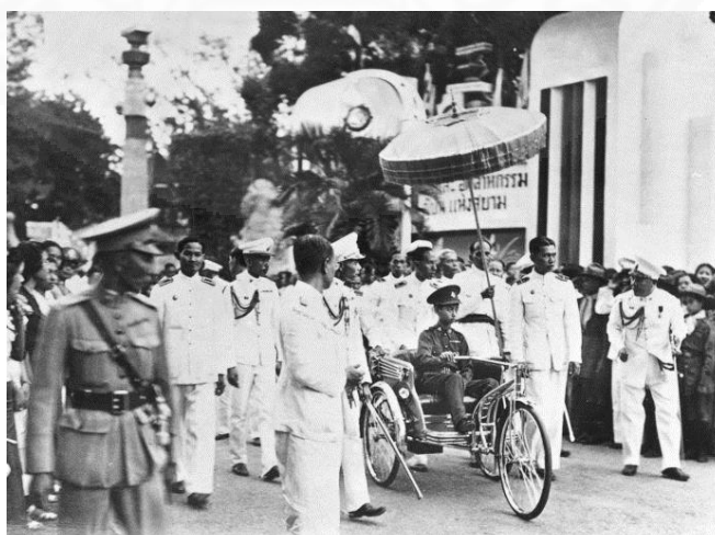
ภาพที่ 3.14 ศิลปวัฒนธรรม, เครื่องมือออนไลน์, “ศิลปวัฒนธรรม,” https://www.silpa-mag.com/old-photos-tell-the-historical-story/events/article_4741 (สืบค้นเมื่อวันที่ 20 กุมภาพันธ์ 2561).

การประกวดนางสาวไทย เริ่มจัดครั้งแรกในวันที่ 10 ธันวาคม พ.ศ.2477 ภายหลังจากเปลี่ยนแปลงการปกครอง พ.ศ. 2475 โดยใช้ชื่อว่า “นางสาวสยาม” รัฐบาลได้จัดขึ้นในงานเฉลิมฉลองรัฐธรรมนูญ ภายในพระราชอุทยานสราญรมย์ ซึ่งเป็นสโมสรคณะราษฎร ในปี พ.ศ. 2477 ซึ่งเป็นการเฉลิมฉลองรัฐธรรมนูญเป็นปีที่สอง เพื่อใช้เวทีนางงามเป็นแม่เหล็กดึงดูดความสนใจให้คนเข้ามางานฉลองรัฐธรรมนูญ