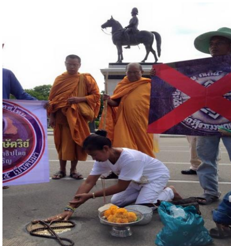
ภาพที่ 3.35 “พิธีกรรมหมุดคณะราษฎร,” https://www.matichon.co.th/prachachuen/news_533837 (สืบค้นเมื่อวันที่ 29 มีนาคม 2561).

หลังรัฐประหาร 22 พฤษภาคม 2557 ได้ไม่นานที่ก็มีความพยายามหลายครั้งที่จะทำการลทอนหรือทำให้หมุดคณะราษฎรหมดความหมายและหมดสภาพไป และนี่ก็เป็นอีกครั้งหนึ่งที่มีคนบางกลุ่มมาทำพิธีถอนหมุดสะท้อนว่า คนเหล่านี้มิได้ศรัทธาต่อระบอบประชาธิปไตยแต่อย่างใด โดยเมื่อเดือนมิถุนายน 2558 ชาวบ้านกลุ่มหนึ่งกำลังทำพิธีกับหมุดคณะราษฎร ที่ฝังไว้ข้างพระบรมรูปทรงม้า บริเวณถนนหน้าพระที่นั่งอนันตสมาคม โดยเป็นการทำพิธีถอนหมุดออก แต่เป็นเพียงแค่การทำพิธีตามความเชื่อเท่านั้น เป็นการสะท้อนว่าอนุสาวรีย์ประชาธิปไตยและหมุดคณะราษฎรนั้นเป็นสัญลักษณ์ประชาธิปไตย มีความหมายในเสรีนิยมเชิงสัญลักษณ์อย่างเข้มข้น