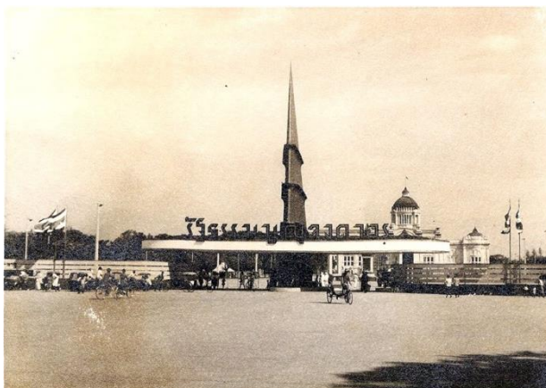
ภาพที่ 3.11 งานฉลองรัฐธรรมนูญ บริเวณสวนอัมพรมีข้อความ “รัฐธรรมนูญจงถาวร, ” https://board.postjung.com/919507.html (สืบค้นเมื่อวันที่ 4กุมภาพันธ์2561).