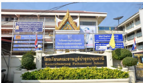
ภาพที่ 3.20 โรงเรียนคณะราษฎรบำรุงปทุมธานี, ภาพจาก: http://www1.obec.go.th:8081/news/46368 (สืบค้นเมื่อวันที่ 20 กุมภาพันธ์ 2561).