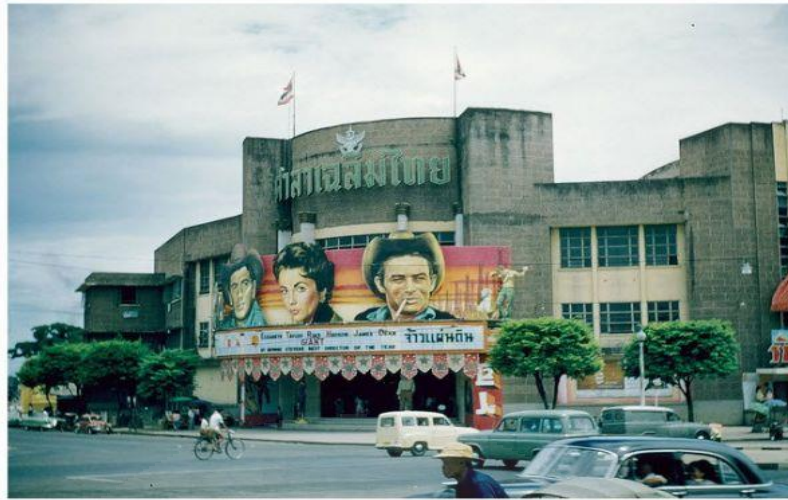
ภาพที่ 3.30 ศาลาเฉลิมไทย.

ศาลาเฉลิมไทย ปัจจุบันถูกรื้อทิ้งเพื่อเปิดพื้นที่ให้สามารถมองเห็นวัดราชนันทดา และมีการสร้างลานพลับพลามหาเจษฎาบดินทร์ อนุสาวรีย์รัชกาลที่ 3 แทนที่เดิม “ศาลาเฉลิมไทยปิดบังวัดราชนันทดา มีแต่สถาปัตยกรรมที่เสื่อมทราม คณะผู้ก่อการเปลี่ยนแปลงที่ก่อสร้างถนนราชดำเนินกลาง ไม่ได้มีใจรักศิลปวัฒนธรรมไทยแต่อย่างใดเลยแล้วก็ไม่เห็นพระพุทธรูปศาสนาเป็นสิ่งสำคัญด้วย จึงสามารถทำกับวัดราชนันทดาได้ถึงเพียงนี้ควรยินดีที่จะรื้อ” (ม.ร.ว.คึกฤทธิ์ ปราโมช) สะท้อนถึงแนวคิดของม.ร.ว.คึกฤทธิ์ ที่มองว่าภาพของสังคมไทยหรือศิลปกรรมไทยนั้น คือ ราชวัง วัดวาอารามเท่านั้น