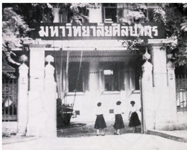
ภาพที่ 3.21 มหาวิทยาลัยศิลปากร, ภาพจาก: https://www.dek-d.com/board/view/2147067/ (สืบค้นเมื่อวันที่ 20 กุมภาพันธ์ 2561).

แม้จะไม่ได้เกี่ยวข้องกับการเปลี่ยนแปลงของคณะราษฎรโดยตรง แต่ภายหลังจากเปลี่ยนแปลงการปกครอง 2475 และยึดอำนาจจากสถาบันพระมหากษัตริย์มาอยู่ที่คณะราษฎร การปฏิวัติการศึกษา คือส่วนหนึ่งอันสำคัญที่เป็นการสร้างประวัติศาสตร์ใหม่ของ คณะราษฎร บนรากฐานตัวตน "สยามใหม่" ที่มีคณะราษฎรเป็นผู้กุมอำนาจในการบริหารประเทศ การจัดสร้างโรงเรียนจึงเป็นส่วนหนึ่งของแนวคิด ในการขยายการศึกษาตลอด 20 ปี ที่คณะราษฎร มีอำนาจ ได้สร้างโรงเรียนทั้งหมด 2 โรงเรียนนั่นก็คือ โรงเรียนคณะราษฎรบำรุง จังหวัดยะลา เป็นโรงเรียนประจำจังหวัดยะลา และ โรงเรียนคณะราษฎรบำรุงปทุมธานีโรงเรียนคณะราษฎรบำรุงชื่อนี้ก็มาจากสมาคมคณะราษฎร และสโมสรคณะราษฎร ที่ได้ให้เงินช่วยเหลือโรงเรียนในการพัฒนาในด้านต่างๆเป็นจำนวนมาก ตามหลักประการที่หกของคณะราษฎรคือ "การศึกษา"