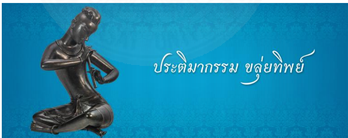
ภาพที่ 3.31 ประติมากรรมขลุ่ยทิพย์, ภาพจาก: http://www.virtualmuseum.finearts.go.th/nationalgallery (สืบค้นเมื่อวันที่ 20 กุมภาพันธ์ 2561).

ศาลาเฉลิมไทย ปัจจุบันถูกรื้อทิ้งเพื่อเปิดพื้นที่ให้สามารถมองเห็นวัดราชนันทดา และมีการสร้างลานพลับพลามหาเจษฎาบดินทร์ อนุสาวรีย์รัชกาลที่ 3 แทนที่เดิม “ศาลาเฉลิมไทยปิดบังวัดราชนันทดา มีแต่สถาปัตยกรรมที่เสื่อมทราม คณะผู้ก่อการเปลี่ยนแปลงที่ก่อสร้างถนนราชดำเนินกลาง ไม่ได้มีใจรักศิลปวัฒนธรรมไทยแต่อย่างใดเลยแล้วก็ไม่เห็นพระพุทธรูปศาสนาเป็นสิ่งสำคัญด้วย จึงสามารถทำกับวัดราชนันทดาได้ถึงเพียงนี้ควรยินดีที่จะรื้อ” (ม.ร.ว.คึกฤทธิ์ ปราโมช) สะท้อนถึงแนวคิดของม.ร.ว.คึกฤทธิ์ ที่มองว่าภาพของสังคมไทยหรือศิลปกรรมไทยนั้น คือ ราชวัง วัดวาอารามเท่านั้น