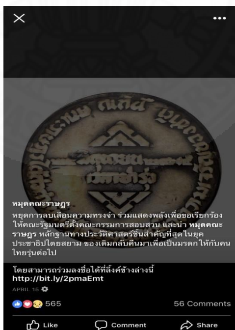
ภาพที่ 4.1 เฟสบุ๊กหมุดคณะราษฎร, “กระแสมุดคณะราษฎร,” (สืบค้นเมื่อวันที่ 15 พฤศจิกายน 2560).

การสร้างให้รัฐธรรมนูญเป็นสิ่งศักดิ์สิทธิ์ โดยมีพิธีอันเชิญและมิงานเฉลิมฉลองในยุศพระยาพหลพลพยุหเสนานั้น ก็เพื่อสร้างให้รัฐธรรมนูญนั้นเข้ามาแทนที่สมบูรณาญาสิทธิราชย์หรือการพยายามจำกัดบทบาทกษัตริย์ในยุคจอมพล ป. พิบูลสงครามก็เพื่อเป็นการตัดขาดจากจารีตเดิม และเป็นการตัดความเชื่อมโยงกับประชาชนก็เพื่อให้เกิดการลืมจารีตประเพณีในระบอบเก่าลง เพื่อพร้อมรับกับวัฒนธรรมสมัยใหม่ที่เข้ามาแทนที่ การพยายามสร้างสถาปัตยกรรมคณะราษฎรบนพื้นที่ของสมบูรณาญาสิทธิราชย์ซึ่งคือราชดำเนิน ก็เป็นการช่วงชิงความทรงจำอำนาจเชิงพื้นที่ ที่จะสร้างเป็นอาณาเขตของระบอบใหม่นั้นเอง