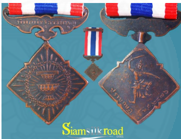
ภาพที่ 3.2 เหรียญพิทักษ์รัฐธรรมนูญ (ปราบกบฏ 2476), ภาพจาก: siamsilkroad.com (สืบค้นเมื่อวันที่ 2 มกราคม 2561).

“ถือเป็นสัญลักษณ์ที่รุนแรงในด้านสถาปัตยกรรมและสะท้อนความสัมพันธ์เชิงอำนาจในพื้นที่สาธารณะอีกรูปแบบหนึ่ง” 1 ซึ่งแตกต่างกับสถาปัตยกรรมในสมัยอนุรักษ์นิยมก่อนปฏิวัติ 2475 ที่มีลวดลายช่อฟ้า ใบระกา ฯลฯ และบ่งบอกถึงการมีลำดับชั้น วรรณะ โดยเมรุชั่วคราวนี้เป็นการพยายามสะท้อนถึงความเท่าเทียมกันตามหลักเสรีภาพและเสมอภาค 1 ในหลัก 6 ประการของรัฐบาลคณะราษฎร