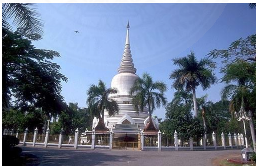
ภาพที่ 3.8 วัดพระศรีมหาธาตุวรมหาวิหาร, https://mgronline.com/onlinesection/detail/9600000004040 (สืบค้นเมื่อวันที่ 4 กุมภาพันธ์ 2561).

โรงแรมรัตนโกสินทร์บริเวณถนนราชดำเนินซึ่งสร้างตามรูปแบบสถาปัตยกรรมสากลร่วมยุค นำเสนอประเทศไทยในฐานะอารยประเทศทัดเทียมกับตะวันตก สถาปัตยกรรมจะไม่มีลวดลาย กนก ซ่อฟ้าหรือใบระกาที่สะท้อนลำดับชั้นเหมือนยุคอนุรักษนิยม