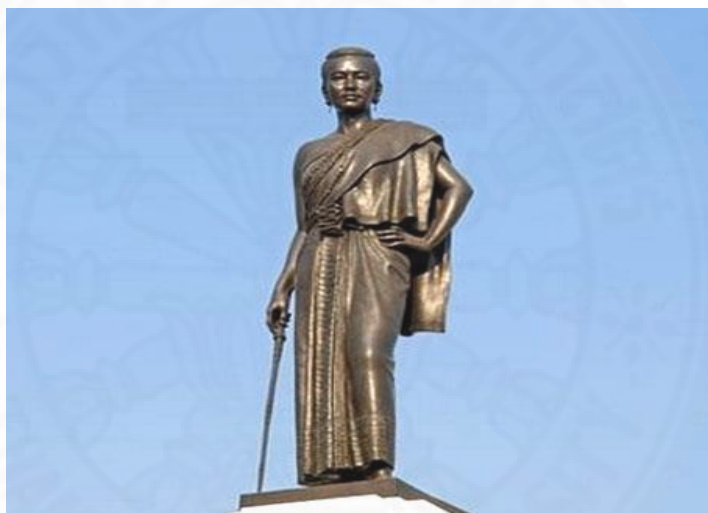
ภาพที่ 3.4 อนุสาวรีย์ท้าวสุรนารี, ภาพจาก: http://www.remawadee.com/koraj/ya-mo.html (สืบค้นเมื่อวันที่ 6 กุมภาพันธ์ 2561).

สร้างอนุสาวรีย์ทหารปราบกบฏ พ.ศ. 2476 ขึ้นเพื่อบรรจุอัฐิวีรชนจำนวน 17 คน” 3 และสร้างขึ้นบริเวณทุ่งบางเขน ซึ่งเป็นสมรภูมিরบระหว่างฝ่ายรัฐบาล ที่นำโดยจอมพล ป.และฝ่ายอนุรักษนิยมที่นำโดยพระองค์เจ้าบรมเดช ตัวอนุสาวรีย์ออกแบบโดยสื่อถึงหลักทางการเมืองของรัฐบาล 5 ประการคือ ชาติ ศาสนา พระมหากษัตริย์ กองทัพและรัฐธรรมนูญ โดยรูปร่างของอนุสาวรีย์มีลักษณะคล้ายกระสุนปืนใหญ่ สื่อความหมายถึงกองทัพ ประดับกลีบบัวประดับซ้อนขึ้นไป 2 ชั้น บนฐานรูปแปดเหลี่ยมซึ่งหมายถึงทิศทั้งแปดตามคติพราหมณ์ ฐานของอนุสาวรีย์มี 4 ทิศ มีบันไดวนรอบฐาน ส่วนบนสุดของเสาอนุสาวรีย์เป็นพานรัฐธรรมนูญซึ่งหมายถึง การสละชีพเพื่อพิทักษ์รัฐธรรมนูญ การก่อสร้างแล้วเสร็จในปี พ.ศ. 2479 ปัจจุบันอยู่ในระหว่างการรื้อ(ย้าย) เพื่อรองรับการก่อสร้างรถไฟฟ้ารูปแบบของอนุสาวรีย์นี้ยังกลายเป็นต้นแบบของอนุสาวรีย์ประชาธิปไตยที่ถนนราชดำเนินด้วย