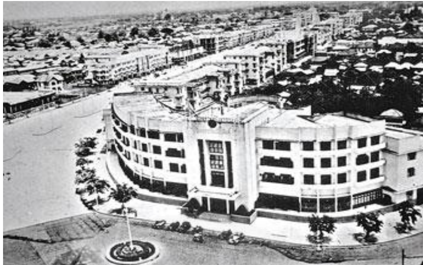
ภาพที่ 3.7 โรงแรมรัตนโกสินทร์ ถนนราชดำเนิน, “โลกใบใหญ่ สถาปัตยกรรม-มรดก 2475: สถาปัตยกรรมคณะราษฎร,” https://www.sarakadee.com/2009/09/10/architect/ (สืบค้นเมื่อวันที่ 4 กุมภาพันธ์ 2561).

โรงแรมรัตนโกสินทร์บริเวณถนนราชดำเนินซึ่งสร้างตามรูปแบบสถาปัตยกรรมสากลร่วมยุค นำเสนอประเทศไทยในฐานะอารยประเทศทัดเทียมกับตะวันตก สถาปัตยกรรมจะไม่มีลวดลาย กนก ซ่อฟ้าหรือใบระกาที่สะท้อนลำดับชั้นเหมือนยุคอนุรักษนิยม