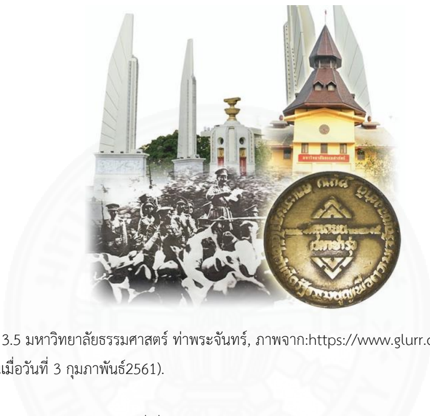
ภาพที่ 3.5 มหาวิทยาลัยธรรมศาสตร์ ท่าพระจันทร์, ภาพจาก: https://www.glurr.com/topic/571 (สืบค้นเมื่อวันที่ 3 กุมภาพันธ์ 2561).

การสร้างอนุสาวรีย์ท้าวสุรนารีนั้นถือเป็นนัยสะท้อนบริบททางสังคมไทยที่เกี่ยวข้องกับการเมืองอย่างชัดเจน 4 โดยเป็นการให้ความสำคัญและยกย่องเชิดชูสามัญชนขึ้นเป็นวีรสตรี ในการกอบกู้บ้านเมืองซึ่งเป็นครั้งแรกที่เกิดขึ้นในสังคมไทย