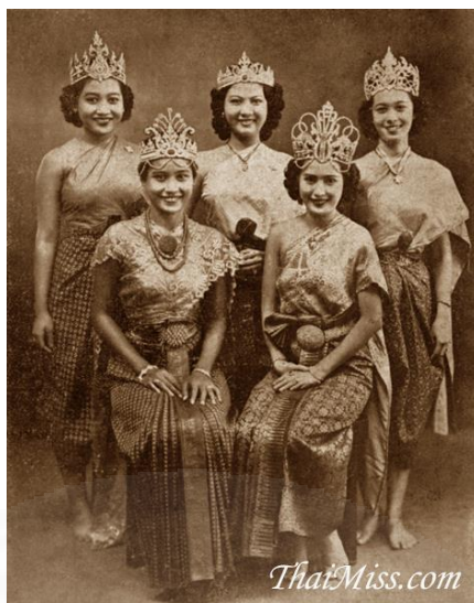
ภาพที่ 3.13

การประกวดนางสาวไทย เริ่มจัดครั้งแรกในวันที่ 10 ธันวาคม พ.ศ.2477 ภายหลังจากเปลี่ยนแปลงการปกครอง พ.ศ. 2475 โดยใช้ชื่อว่า “นางสาวสยาม” รัฐบาลได้จัดขึ้นในงานเฉลิมฉลองรัฐธรรมนูญ ภายในพระราชอุทยานสราญรมย์ ซึ่งเป็นสโมสรคณะราษฎร ในปี พ.ศ. 2477 ซึ่งเป็นการเฉลิมฉลองรัฐธรรมนูญเป็นปีที่สอง เพื่อใช้เวทีนางงามเป็นแม่เหล็กดึงดูดความสนใจให้คนเข้ามางานฉลองรัฐธรรมนูญ