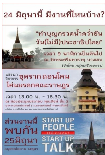
ภาพที่ 3.37 เฟสบุ๊กมหุดคณะราษฎร, “กิจกรรมรำลึกคณะราษฎร (2),”

https://prachatai.com/activity/2017/06/72010 (สืบค้นเมื่อวันที่ 10 มิถุนายน 2560).