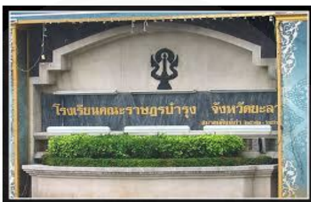
ภาพที่ 3.19 โรงเรียนคณะราษฎรบำรุงยะลา, ภาพจาก: http://oknation.nationtv.tv/blog/political79-2-1/2016/08/11/entry-2 (สืบค้นเมื่อวันที่ 20 กุมภาพันธ์ 2561).

ความเสมอภาค เป็นหลักการสำคัญของคณะราษฎร ดังนั้น การสร้างกลุ่มอาคารศาลฎีกานั้นก็ต้องมุ่งไปที่ความแตกต่างจากสถาปัตยกรรมระบอบเก่าหรือฝ่ายอนุรักษนิยมและเป็นสัญลักษณ์สะท้อนการมีเอกราชทางศาลที่ราษฎรนั้นจะต้องได้รับสิทธิ์ทางศาลผ่านกฎหมายอย่างเสมอภาค “สถาปัตยกรรมคณะราษฎร เป็นงานที่มุ่งสะท้อนอุดมคติเรื่อง ความเสมอภาคอันเป็นหลัก 1 ใน 6 หลักของคณะราษฎรที่ยกชูขึ้นเป็นประเด็นในการปฏิวัติ 2475 อุดมคติดังกล่าวมีเป้าหมายเพื่อต่อต้านและล้มความชอบธรรมของระบอบการปกครองเดิมที่มีการแบ่งชนชั้นของผู้คนในสังคม” 13 ปัจจุบันศาลอาญาได้ถูกรื้อทำลายทิ้งทั้งหมดเพื่อปรับปรุงอาคารใหม่ ไปตั้งแต่ปี 2555