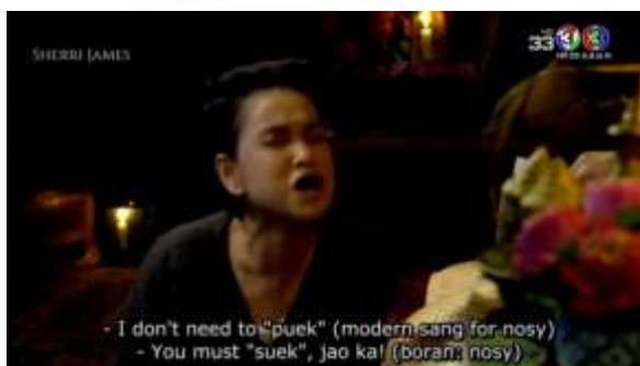
ปริก: แม่หญิงต้องเลือกเจ้าค่ะ

นักแปลแฟนคลับแปลบทสนทนาโดยอธิบายการเล่นคำพ้องที่ปรากฏในฉากอย่างละเอียด โดยแปลการเล่นคำพ้องเป็นข้อความทั่วไปและถอดเสียงคำว่าเผือกและเลือกในวงเล็บ และอธิบายความหมายของสองคำดังกล่าวว่าเป็นคำคนละยุคโดยใช้คำว่า modern slang (แต่สะกดผิดเป็น sang) กับ boran ซึ่งคำหลังเป็นการถอดเสียงคำว่า โบราณ มาจากศัพท์โบราณ/คำโบราณซึ่งไม่สื่อความหมายในภาษาอังกฤษ อย่างไรก็ตาม แม้นักแปลแฟนคลับจะตั้งใจใส่รายละเอียดความหมายของคู่คำพ้องนี้ โดยแปลเป็นประโยค 2 ประโยคติดกันและใช้สัญลักษณ์ขีด (-) หน้าประโยคเพื่อแจ้งให้ทราบว่า เป็นคนละประโยค แต่ด้วยบทสนทนาต้นฉบับดำเนินอย่างต่อเนื่อง แฟนคลับประโยคนี้อาจปรากฏค้างบนจอเพียง 3 วินาทีเท่านั้น