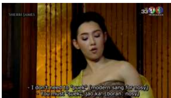
การะเกด: ข้าไม่ต้องเข้าไปเผือกหรือ